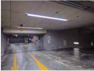
本館地下1階 駐車場

また、今回取り替えた本館7階会議室内のLED照明はプロジェクターなどをご使用の際、部分的に照明を消すことのできるリモコンもございます。ご必要の方は本館1階総合受付へお申し付けください。