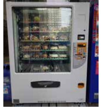
南館正面入口横 パン用自動販売機