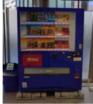
南館1階内 自動販売機