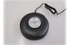
スピーカーフォン