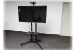
50インチ液晶モニター

カメラ(三脚付き)・・・2,200円(税込) スピーカーフォン ...3,300円(税込) 50インチ液晶モニター・・・8,800円(税込) LED照明(スタンド付き)・・・550円(税込)