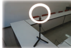
LED照明(スタンド付き)